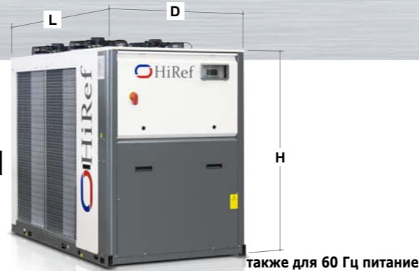
также для 60 Гц питание

С ВОЗДУШНЫМ ОХЛАЖДЕНИЕМ КОНДЕНСАТОРА И СПИРАЛЬНЫМИ КОМПРЕССОРАМИ С ИНВЕРТОРНЫМ ДВИГАТЕЛЕМ (SCROLL BLDC INVERTER)